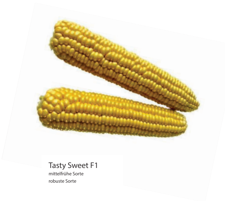
Tasty Sweet F1 mittelfrühe Sorte robuste Sorte