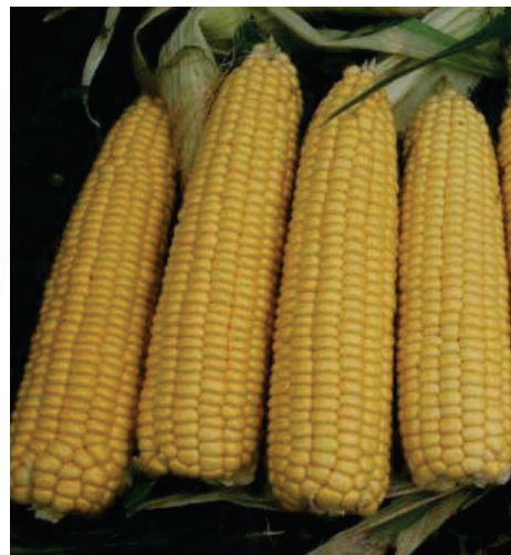
Earlibird F1 schnelle Entwicklung frühe Sorte