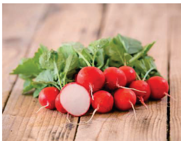
Melito F1 gute Platzfestigkeit für den Ganzjahresanbau