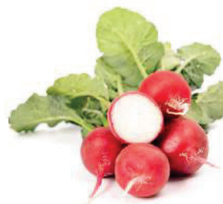
Bodiam F1 leuchtend rote Knolle Früh- und Herbstanbau im Freiland