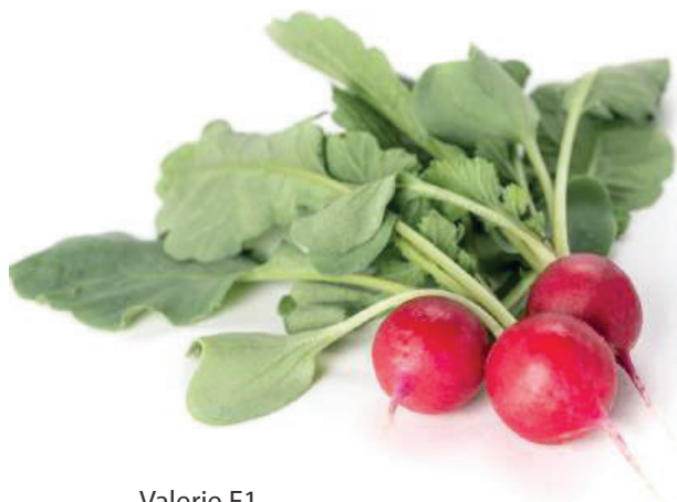
Valerie F1 leuchtend rot sehr uniform