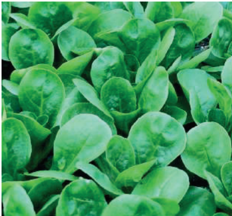
Klara aufrechter Wuchs weites Erntefenster