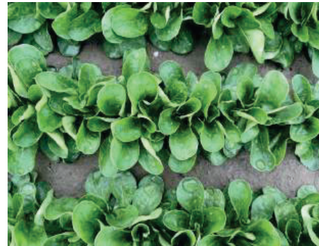
NOV8559VL sehr schnell wachsend halb aufrechter Wuchs