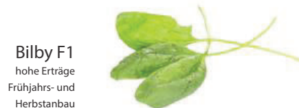
Bilby F1 hohe Erträge Frühjahrs- und Herbstanbau