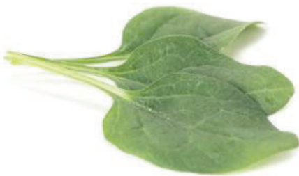
Eagle F1 gleichmäßig langes Erntefenster